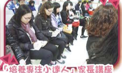
「培養專注小達人」家長講座