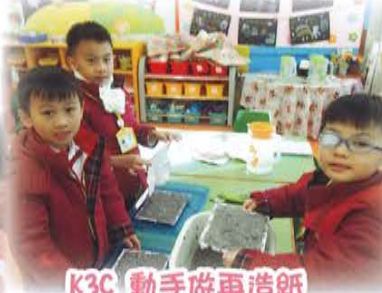
K3C 動手做再造紙 認識再造紙的材料及製作 過程。