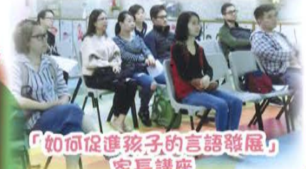
「如何促進孩子的言語發展」家長講座