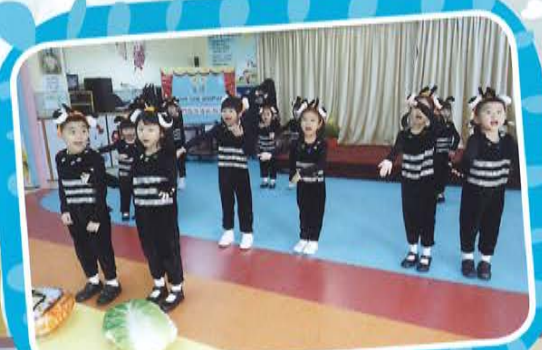
第70屆香港學校音樂節音樂唱遊(普通話)