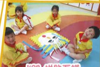
K2B 拼貼面譜 與同學一起發揮創意， 合作創作面譜。