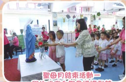
聖母月結束活動— 學生代表向聖母媽媽獻花