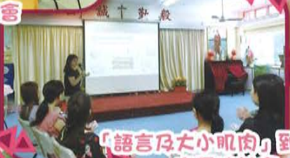
「語言及大小肌肉」到校支援家長檢討會