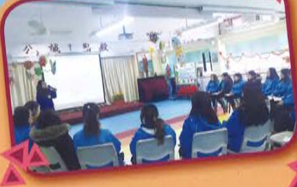
「提升教師對專注力不足及過度活躍症的甄別及介入策略教師培訓工作坊」