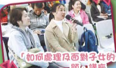
「如何處理及面對子女的情緒行為問題」講座