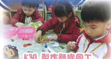
K3B 製作麵條圖工 透過創作圖工，認識不同 顏色和形狀的麵條。