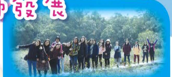
「教師鬆一鬆」參觀西貢鹽田梓外出活動