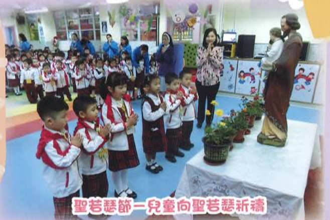
聖若瑟節—兒童向聖若瑟祈禱