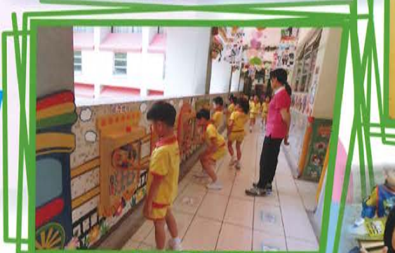
小一模擬活動 (模擬小息到走廊自選活動)