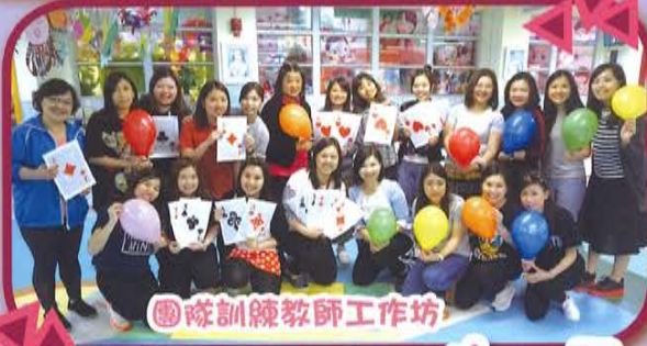
隊訓練教師工作坊