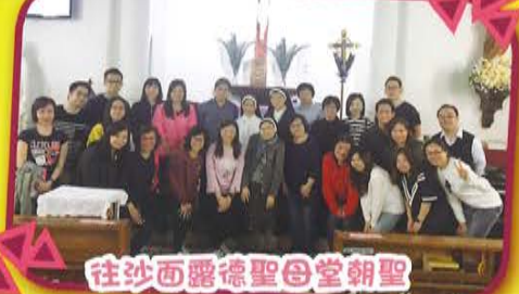
往沙面露德聖母堂朝聖