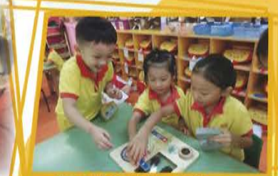
K3D 神奇的磁鐵 透過實驗，探索磁鐵的特性。