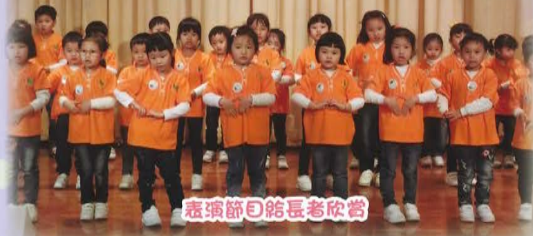
表演節目給長者欣賞