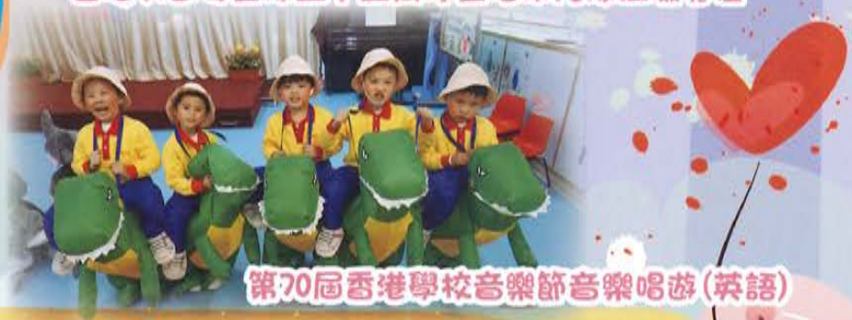
第70屆香港學校音樂節音樂唱遊(英語)