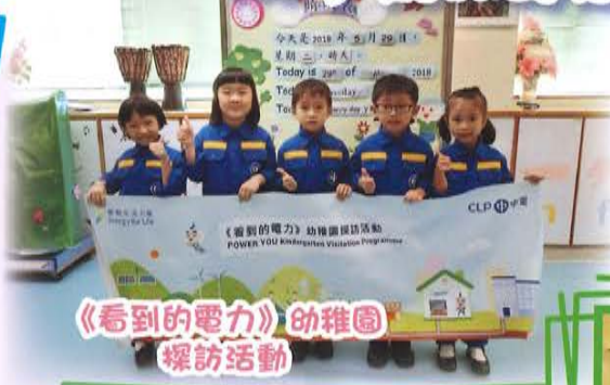
《看到的電力》幼稚園 探訪活動