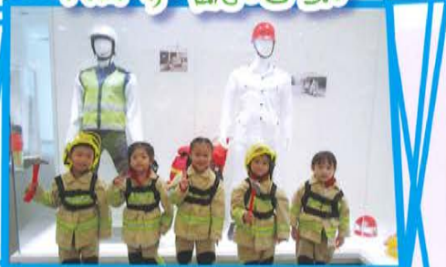
消防及救護教育中心暨博物館