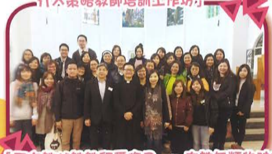
「天主教公教教師靈修日」- 有教無類的神修