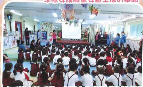
復活節宗教活動—老師向兒童講述耶穌復活的事蹟