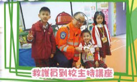
救護員到校主持講座