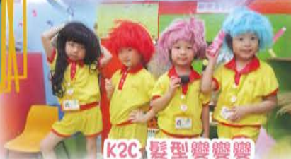
K2C 髮型變變變 認識不同的髮型。