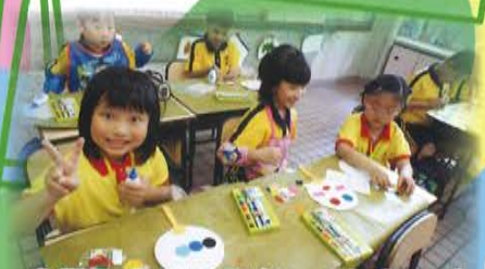
參觀聖安當小學(小一體驗活動)