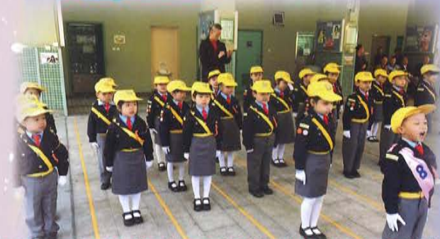
香港交通安全隊五十五周年全港幼兒隊伍檢閱禮