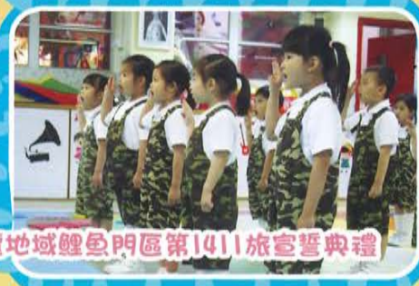
東九龍地域鯉魚門區第141旅室誓典禮