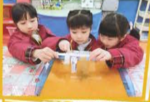
K3A 紙真好玩 探索不同紙張的吸水能力。