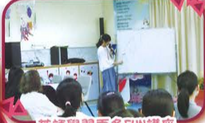
英語學習更多FUN講座