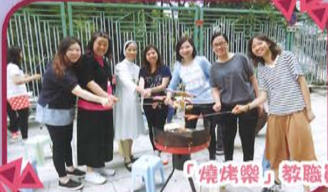
「燒烤樂」教職員聯誼活動