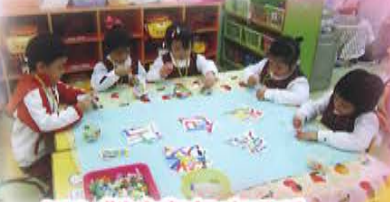
K2D 製作麵包店招牌 為麵包店的開幕日作出準備。