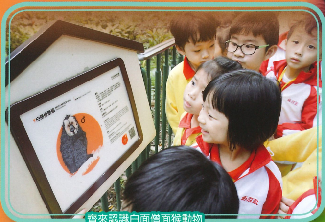
齊來認識白面僧面猴動物