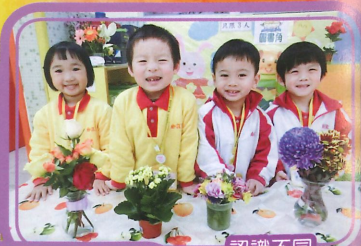
認識不同種類的花朵