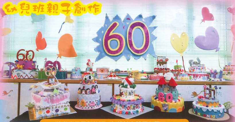
幼兒班同學與爸媽一起設計立體蛋糕圖工。

低班同學與爸媽一起創作圖畫，圖畫底部只印有一株小幼苗的圖案，家長們和幼兒發揮創意；在空白位置上加上各種別具意義的圖案，又填上繽紛的色彩。