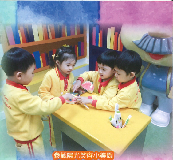
參觀陽光笑容小樂園