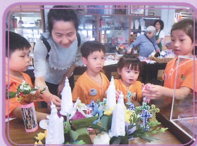
幼兒正在欣賞長者製作的手工藝。