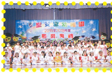
高班畢業生一同大合唱感謝母校的培育以及父母的養育之恩。