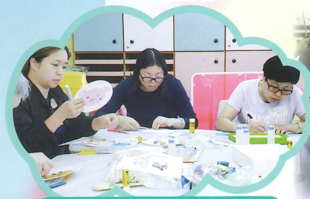
家長發揮他們的創意製作教具。

駐園社互透過「趣味教具DIY」家長工作坊，讓家長學習製作富趣味性及具教育意義的教具。完成後，可以讓孩子在家中學習。