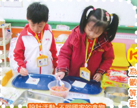
設計活動-不同國家的食物