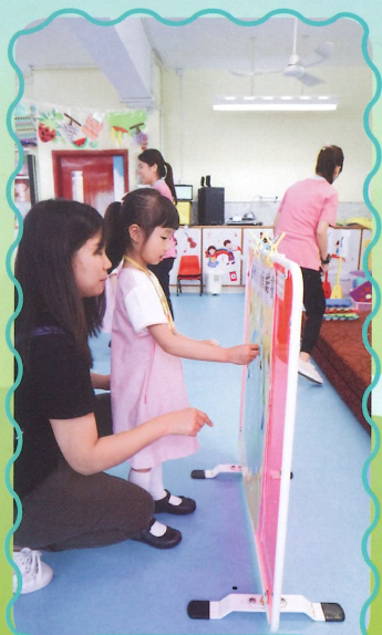
小朋友和家長一起承諾節約用水。