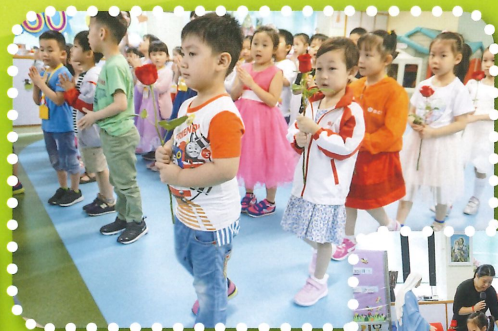
結束聖母月祈禱聚會中，各班代表獻上鮮花給聖母。