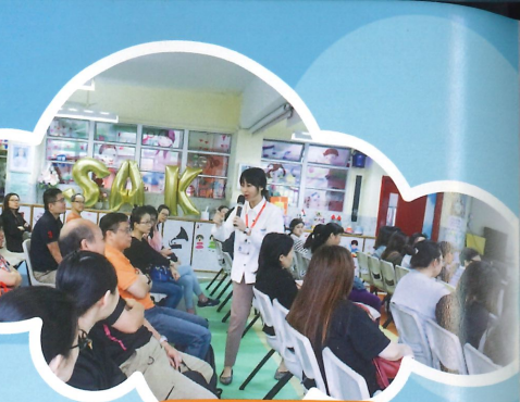
家長樂於分享在家中教養孩子的經驗。