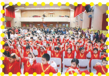
家長到校參加畢業典禮一同分享子女的學習成果。