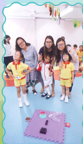
家長和小朋友一起用環保物料拼湊出一個樣子。