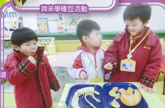
一起探索水果的味道