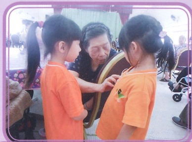
幼兒正在與長者交談，學習與他們交流。

基督小幼苗聯同聖安堂小學的基督小先鋒探訪老人院活動，履行「敬主愛人，事事關心，熱心服務，常懷感恩」的精神。在探訪老人院期間，基督小幼苗除了為長者表演外，還學習與他們交流，最後給長者送上禮物，以表達關懷和敬意。