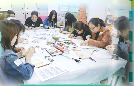
家長倒一起學習製作教具。