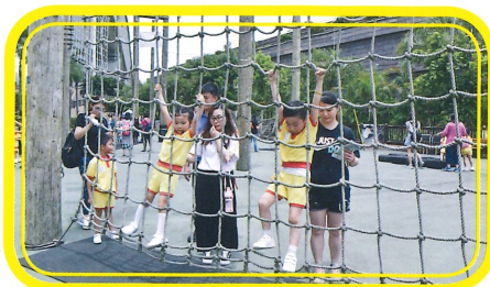
小朋友不畏懼一同挑戰繩網。