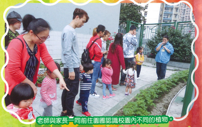
老師與家長一同前往園圃認識校園內不同的植物。

本校老師參加語常會舉辦的「幼兒中、英文發展計劃」，並與大家一起分享有關提升幼兒中、英語能力的教學技巧及方法。