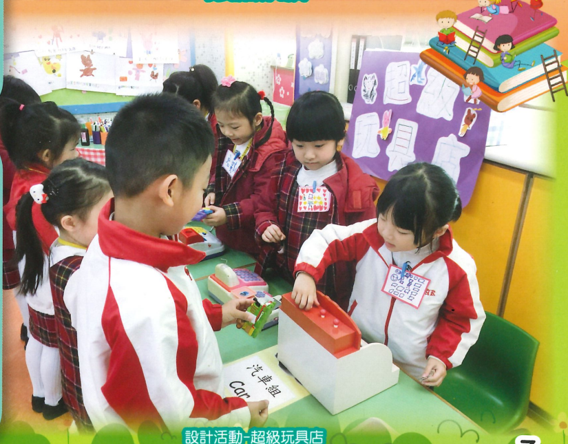
設計活動-超級玩具店