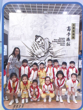
香港文化博物館內的「高手過招」，家長和小朋友一起參與。