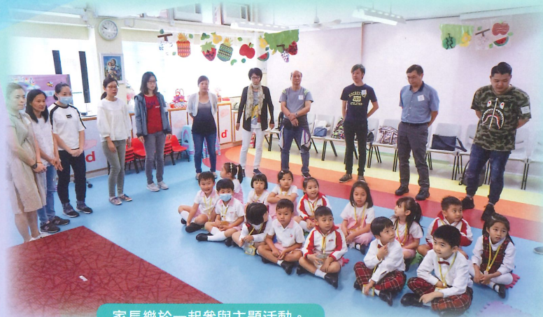
家長樂於一起參與主題活動。

低班及高班下學期進行家長觀課活動，目的讓家長有機會走進校園，了解孩子的學習情況。家長可了解孩子的校園生活及學校的課程特色，並明白學校的教學理念，知道老師的教學方法，家庭和學校互相配合之下使教學更有成效。