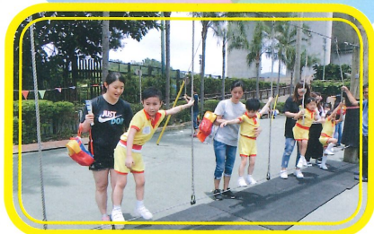
小朋友小心翼翼地在大鞦韆上行走。

學校在拂亞方向舉行高班畢業親子旅行，為幼兒提供一個愉快而富教育意義的戶外活動，幼兒透過不同形式的遊戲有繩網、鞦韆等，增進彼此間的友誼，為幼稚園生活留下一個美好的回憶。