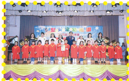
高班畢業生一同接受嘉賓頒發的畢業證書。