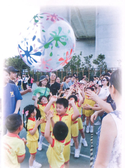
高班畢業生齊心合力將大彩球向後傳到最後一位小朋友。