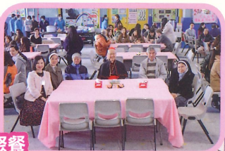
本校校監、校董、校長、老師和神長合照