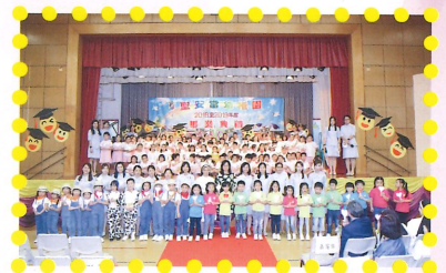
畢業生與校監、校長、老師一同拍照留念。