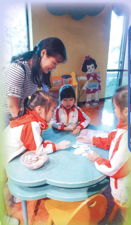
家長和小朋友一起玩香港文化博物館的懷舊玩具。