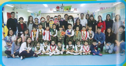
演員與家長及幼兒玩親子遊戲，促進親子關係，最後一同拍照留念。