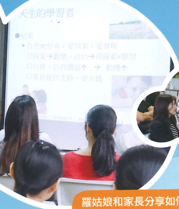
羅姑娘和家長分享如何培養孩子的好奇心和自理能力。

「香港家庭福利會」社互為家長舉辦「培養愛學習的孩子」家長講座，學習如何培養孩子的好奇心和自理能力。