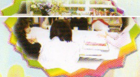
家長義工團 各位義工家長，我們一起來檢 討義工小組的運作。

為了支援家長在教導兒童時所遇到的問題，本校透過不同模式的活動，如專題講座、工作坊、研習班等，來增強家長的育兒技巧。