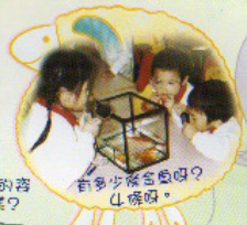
有多少條含魚的？4條呀。