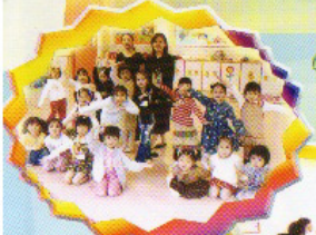
舞蹈小組 我哋的姿勢是否 很又呢！

除了平日課堂活動外，本校更提供不同類型的課餘興趣活動，讓兒童延展學習的動機，擴闊學習的領域，發掘個人的潛能，提升群性的發展。