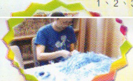
等我協助老師一起製作教材啦。