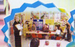
支援家長「英文」研習小組 為了幫子女溫習功課，你看 我們多麼留心。