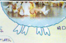
加油！加油！填口填口填此會集一。