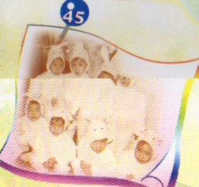
學生見證 學校歷史的轉變