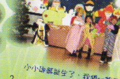
小小耶穌誕生了，我們一起頌拜祂。