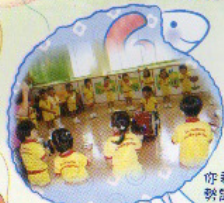
你看！我打鼓的姿勢是否比較好呢？