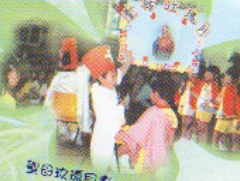
聖日敬禮同嘉，我和以兩式祈禱來祈求世間和平。