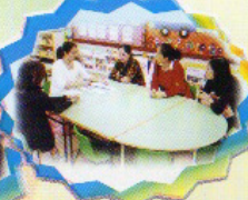
支援家長「普通話」研習小組 來來來，看看這主題教 甚麼聲母及韻母然後 聽聽正確的讀音。