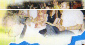
升小學講座 女女升小學的資訊。