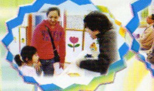
家長專題講座 聽完講座，好像還有些問 題，等我請教婆姑娘先。