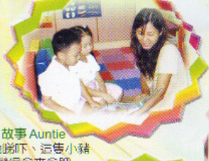
故事 Auntie 你哋踎下，這些小豬 就變得愈來愈肥。