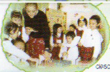
This is K2 choosing, naming and describing different fruits.