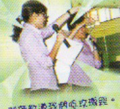
老師教導我們唱玫瑰經。