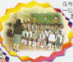
小童軍團 我今天立志宣誓成為 一位愛神愛人、愛國 家的小童軍。