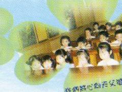
我們誠心向天父禱告。