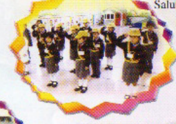
交通安全隊 Patrol General Salute Salute