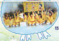
那裡我們團結精神，高努力！