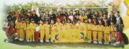
我哋影番張全體親子旅行照片留念啦！