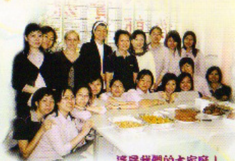
這是我們的大家庭！