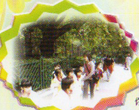
周圍環境好靚嘅！ 你哋一直行就會發現 更多有趣的地方！