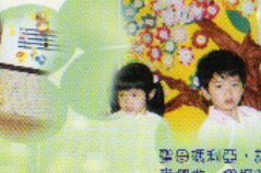
聖日威利亞，請你幫助我們做一個好孩子。