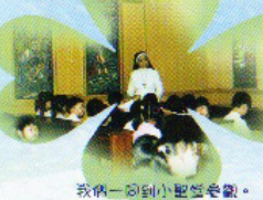
我們一同到小聖堂參觀。