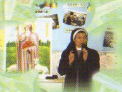
本校請向我們有經驗的堂主任聖人。

當我們享受多姿多彩的校園生活時，當然不可忘記這一切都是天父賜給我們的，因此，兒童每天會藉著早禱來讚美在天父的恩典。為使兒童能體驗天主的愛，學校透過不同的活動，把基督的福音傳播給兒童，更鼓勵他們在生活中實踐，學會為人服務及彼此相愛，共同負起這份福傳的責任。