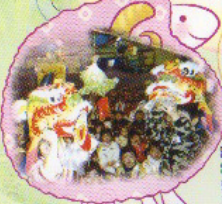
跳高口，跳高口，就飛飛到區對面囉！

我們透過多元化的活動，讓兒童「享受群體的生活」、「體驗學習的樂趣」及「學會自學的能力」。