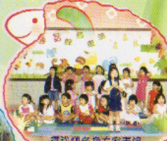
讓我們多為大家盡力