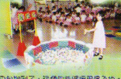
四旬期到了，我們祈禱求聖靈降臨。