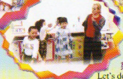
英語話劇小組 Let's do the action together! yeah!well done!