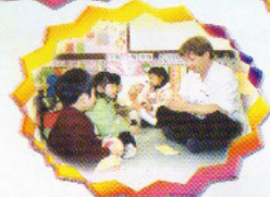
英文繽紛 show. Hey! children! we're now going to play a game.