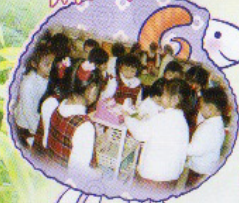
請聽你用信印時，邊印邊念的數碼？