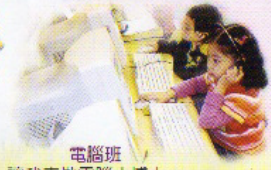
電腦班 讓我來做電腦小博士。

本校致力推動家校合作，透過組織「家長義工團」讓家長與學校一同攜手策劃及帶領不同的活動，使學校與家庭融為一體，共同建立一個「愛的園地」，孕育我們的小種子。