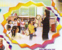
節奏樂班 讓我們利用樂器跟著 節奏打拍子。