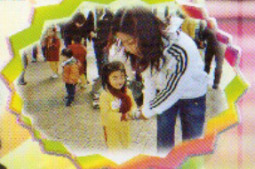
親子旅行 因為我哋快啱合作將 D 物件 運到另一邊囉！