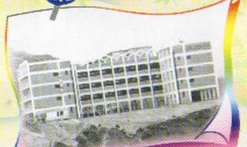
1968年 油塘觀成樂街100號校址