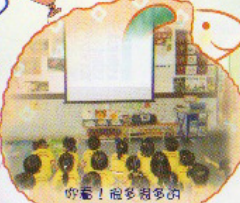
你看！有多多的大魚游出來囉！