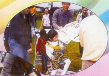
要快走一些，不然會取不到冠軍。