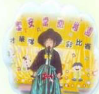
兒童扮演閩大人前來「聖安當幼稚園」為我們高歌一曲《希望》。