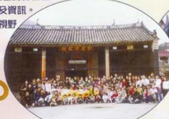
笑一笑 為今次小童軍和交通安全隊聯合旅行來拍照留念。