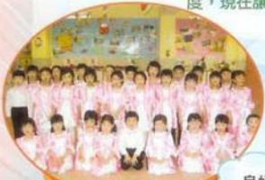
第五十七屆學校音樂節普通話唱遊比賽

轉瞬間本學年即將完結，回想這一年，學校不斷提供機會讓幼兒參與各類校外比賽，目的是希望透過比賽，能增強兒童的自信，發揮個人的潛能和擴闊眼光，最重要的更是建立正確的價值觀和態度，現在讓我們一起分享他們努力的成果。