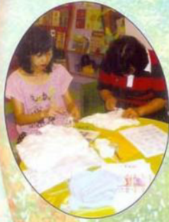
媽媽親手為孩子編織毛衣，真是幸福呢！

為了讓家長發揮自己的興趣及所長，本校提供家長興趣班，而下學期分別舉辦了「編織班」及「烹飪班」，均得到家長的熱烈支持，看到編織班的家長，一針一針的為孩子編織毛衣，充份表現出她們的愛心及耐性，當完成毛衣的一刻，她們的滿足感更是難以言喻；當你走近家長資源中心，聞到陣陣的看氣，便知道烹飪班的家長正努力學習如何烹調美味的小食，好讓心愛的孩子大飽口福，家長們一邊烹調美食，一邊分享育兒心得，每次聚會都輕鬆融洽，還期待著下星期的烹飪班呢！