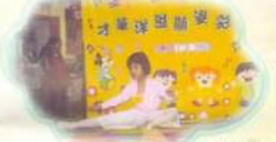
你看！我的舞姿多美妙！