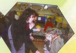
仔仔，你要快一點。加油！