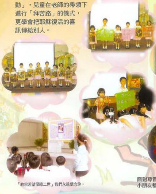
「教宗若望保祿二世」我們永遠懷念你。

為了加深兒童對天主教節日之認識，本校每年都會按不同的節令舉行宗教活動，在今年的三月份便舉行了「復活節宗教活動」，兒童在老師的帶領下進行「拜苦路」的儀式，更學會把耶穌復活的喜訊傳給別人。