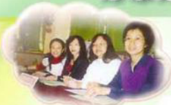
《家長義工團》為我們擔任是次活動之評判，實勞苦功高。