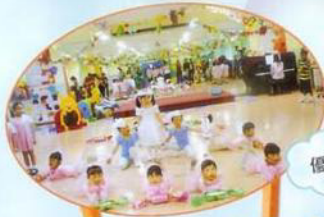
第五十七屆學校音樂節英語唱遊比賽