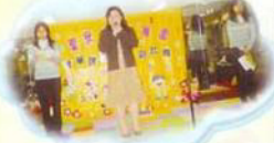
校長為「才華洋溢顯姿彩比賽」揭開序幕。