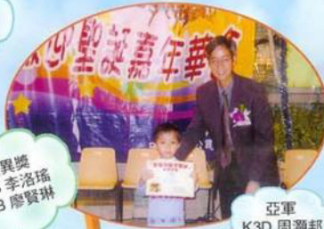
鯉魚門村民聯會主辦歌舞同歡迎聖誕填色比賽