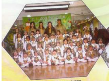
今天我們正式成為小童軍的日子，真值得紀念。