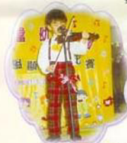
兒童們多才多藝，能歌善舞，亦能彈奏及演奏樂器。你看！我們多投入！