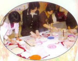
小朋友，你看媽媽多努力，她們正在包春卷呢！

為了讓家長發揮自己的興趣及所長，本校提供家長興趣班，而下學期分別舉辦了「編織班」及「烹飪班」，均得到家長的熱烈支持，看到編織班的家長，一針一針的為孩子編織毛衣，充份表現出她們的愛心及耐性，當完成毛衣的一刻，她們的滿足感更是難以言喻；當你走近家長資源中心，聞到陣陣的看氣，便知道烹飪班的家長正努力學習如何烹調美味的小食，好讓心愛的孩子大飽口福，家長們一邊烹調美食，一邊分享育兒心得，每次聚會都輕鬆融洽，還期待著下星期的烹飪班呢！