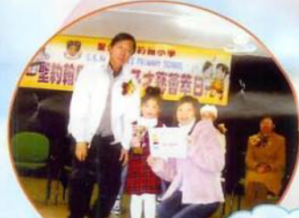
聖約翰小學與您親子才藝匯萃日「關心摯愛付真誠」親子攝影比賽