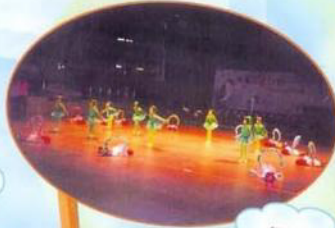
第三十三屆全港學校公開舞蹈比賽