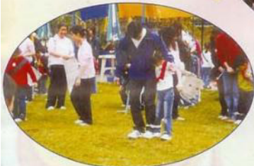
1、2、3左、右、左右。小心報紙會飛破？