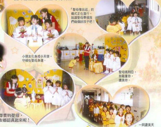
「聖母像出巡」的儀式正在進行，就讓聖母帶領我們做個好孩子吧！

五月份是聖母月，所以學校分別舉行了「聖母月開始」及「聖母月結束」的活動，其間兒童更首次在校內參與「聖母像出巡」，亦學懂把好行為作為奉獻給聖母的禮物，並在「聖母月結束」的活動中獻上花環給聖母瑪利亞。