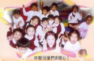
你看！兒童們多開心！