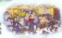
各參賽學生之家長亦抽空前來為子女打氣及攝錄精彩的表演。