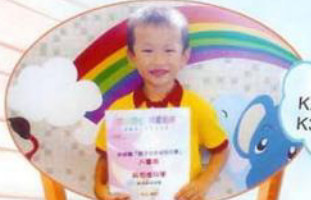
觀塘區公民教育活動幼稚園親子倡廉填色比賽