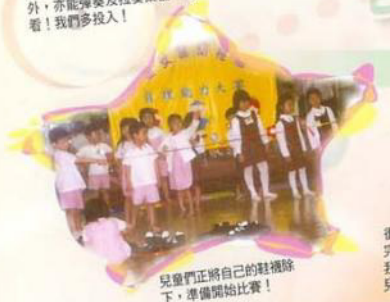
兒童們正將自己的鞋襪放下，準備開始比賽！