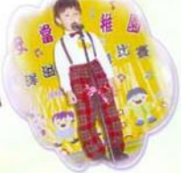
大家好！我會為大家唱出《對面的女孩看過來》，請大家細心欣賞。