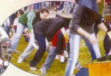
快！快！水杯的水快溜走了。