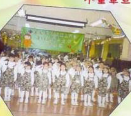
見到旗長當然要行個禮。