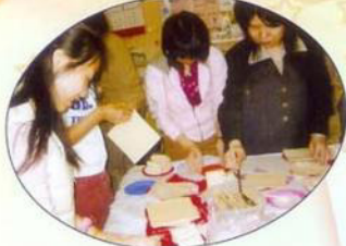
多加些餡料，讓春卷更美味。快將完成了，很想品嚐自己努力的成果嗎！