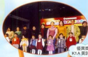
教育出版社有限公司舉辦全港幼稚園來說普通話2005