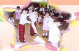
兒童除了需要穿上鞋襪外，還要穿上外套，並扣好鈕子。