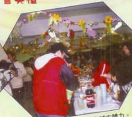
宣誓完畢，要吃些食物來補充體力。