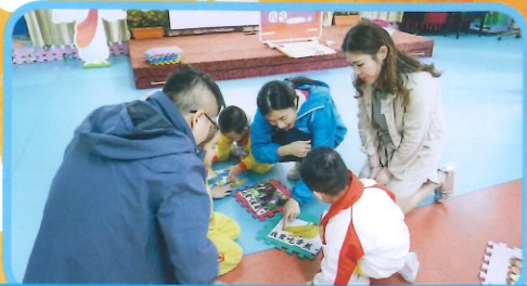
幼兒與家長一同玩拼圖遊戲，並以普通話說出拼圖物品的名稱。

家長透過觀課，更了解孩子在校學習英文及普通話的情況，亦體驗到有效的互動遊戲，如：模擬買書、拼圖等遊戲，對幼兒學習的重要。觀課當日，家長投入參與，亦表示認同及欣賞學校的課程。