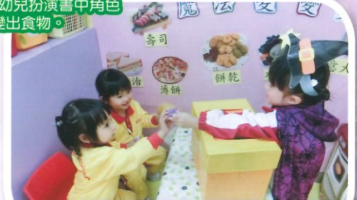
主題<<食物>>幼兒扮演書中角色小女巫變出食物。

幼兒透過多元豐富的校內生活，如：聖日無玷始胎節祈禱會、道路安全講座、多感官探索等活動。另外，幼兒亦能在分組時段聆聽故事媽媽講述故事、到園圃學習種植常識等，豐富幼兒的生活經驗。