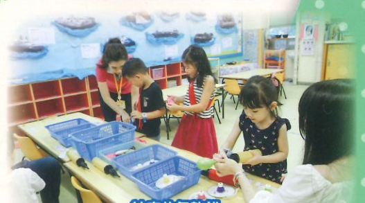
神奇的氣墊船(STEM學習區) 透過氣墊船的小實驗，幼兒能認識到氣墊船的運作原理。