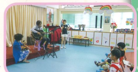
樂韻英文民歌(音樂區) 幼兒學唱歌學英文。