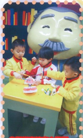
參觀陽光笑容小樂園，學習保護牙齒的方法。