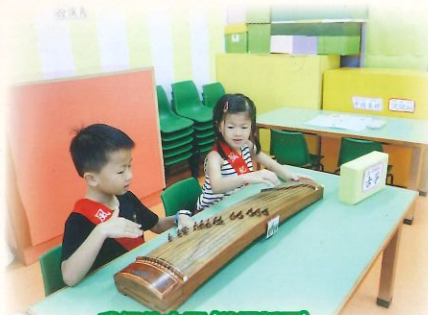
我們的中國(普通話區) 課室內展示了很多中國文化的物品，讓幼兒認識中國文化。