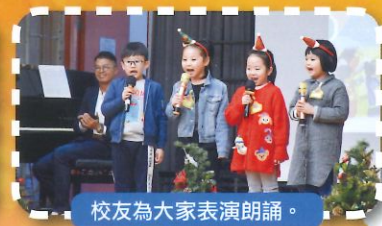
校友為大家表演朗誦。