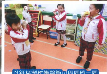
以紙杯製作傳聲筒，與同儕一同探索聲音的傳遞。