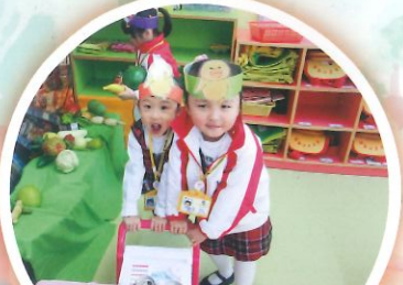
主題<<食物>>老師運用繪本<<小雞逛超市>>作引入主題，故事中的小雞角色吸引幼兒，她們正在扮演繪本裡的主角小雞，一同經營超市。

幼兒參與報佳音、探索學習、小食嚐試來讓幼兒從體驗中學習。幼兒透過參與小學攤位、哥哥姐姐到訪等活動來體驗小學生活及培養群體能力。此外，外籍及普通話老師會在課堂上與幼兒愉快互動，提升幼兒對語文的學習興趣。