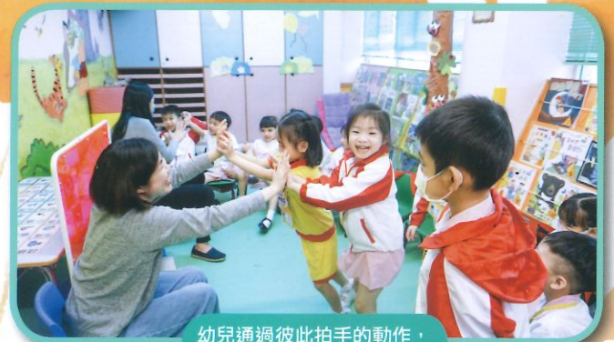
幼兒通過彼此拍手的動作，來表達正面的情緒。