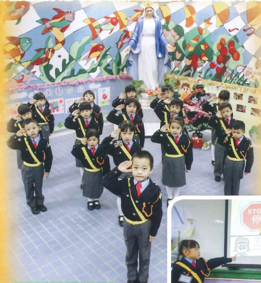
本校幼兒交通安全隊一起立正敬禮。

本校幼兒交通安全隊隸屬香港交通安全隊。該會宗旨為加強運輸交通安全常識，培養幼兒責任感及自律性。