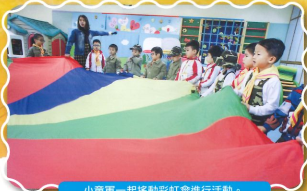
小童軍一起搖動彩虹傘進行活動。