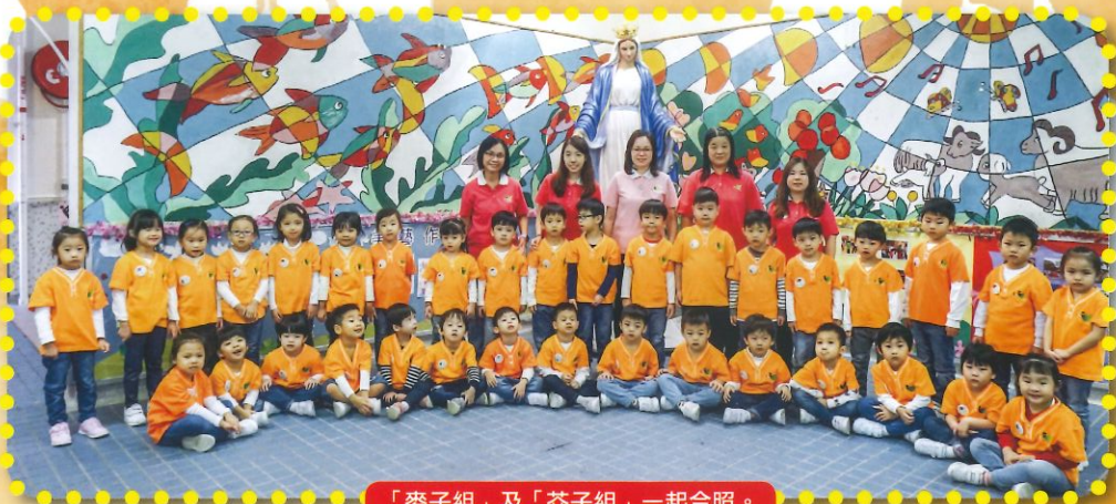
「麥子組」及「芥子組」一起合照。

基督小幼苗透過祈禱、歌詠、探訪等多元化活動，培養幼兒敬主愛人、事事關心、熱心服務及常懷感恩的心。