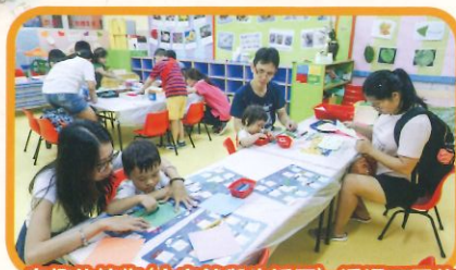
有趣的植物(大自然與生活區) 透過不同的植物及不同的圖工物料，發揮幼兒的創意，帶出愛護大自然訊息。