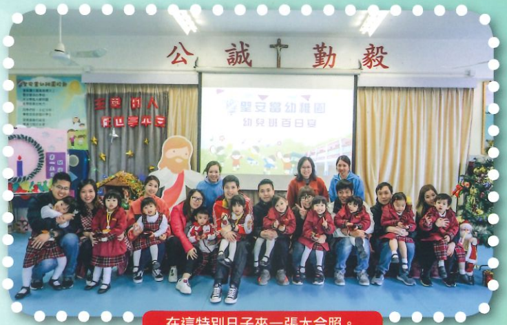
在這特別日子來一張大合照。

慶祝幼兒班幼兒入學踏入一百天，本年度舉辦「幼兒班百日宴」，邀請家長到校一同參加玩遊戲，慶祝幼兒順利適應校園生活，與家長們見證幼兒進步和成長；家校合作，互相鼓勵支持。