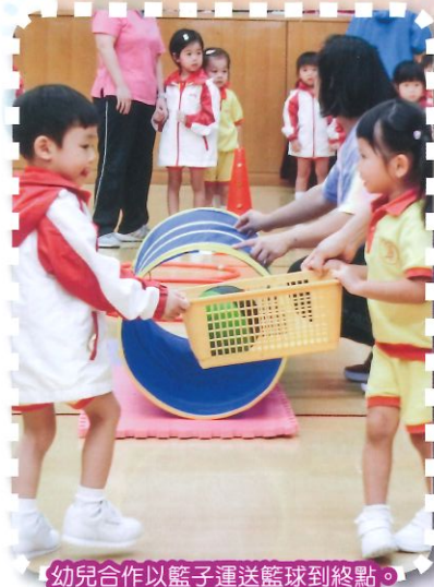
幼兒合作以籃子運送籃球到終點。