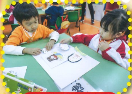
團員們繪畫了自己的樣子，與耶穌大哥哥做好朋友。