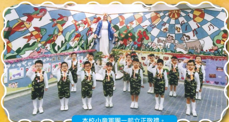
本校小童軍團一起立正敬禮。

本校小童軍團隸屬香港童軍總會。總會宗旨為：提供一項配合小童軍年齡促進其身心發展的活動，使幼兒在家庭及學校外，能夠愉快及健康地學習及成長。小童軍集會主要是提供多元化的遊戲活動，培養幼兒適應有規律的體群生活。