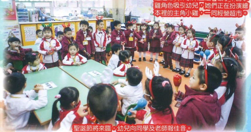
聖誕節將來臨，幼兒向同學及老師報佳音。