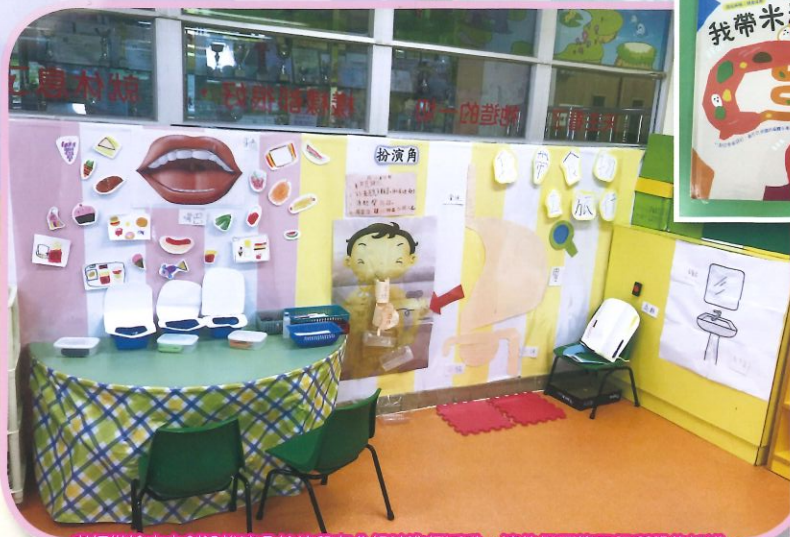
老師從繪本中創設扮演角給幼兒在分組時進行活動，讓他們更能了解所學的知識。

教育局到校專業支援服務：善用閱讀促進幼兒語文發展以幼兒語文發展範疇為切入點，運用繪本配合主題，進行教學，提升幼兒從閱讀興趣中加強語文聽、說、讀、寫的能力。