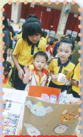
到聖安當小學參與由哥哥姐姐製作的攤位遊戲。