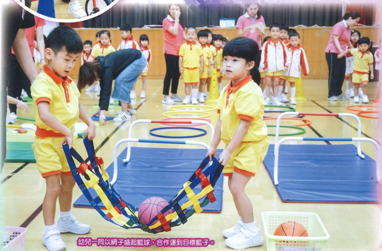
幼兒一同以網子盛起籃球，合作運到目標籃子。