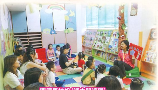
閱讀馬拉松(語文閱讀區) 幼兒在圖書室聽「大象與猴子」的故事。