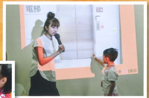
參與機電工程講座，學習接觸機器及電器時的安全知識。