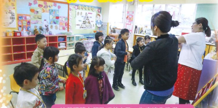
幼兒跟隨老師歌唱英文歌，為表演作準備。