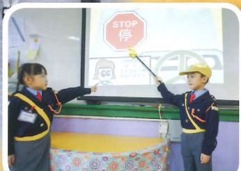
隊員透過活動，認識交通安全常識。