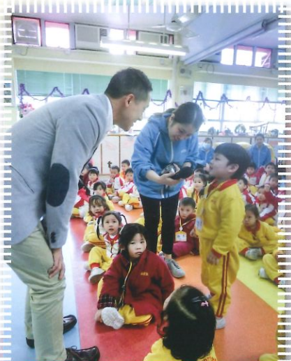
幼兒參與道路安全講座，學習道路安全知識，如使用天橋、隧道過路。