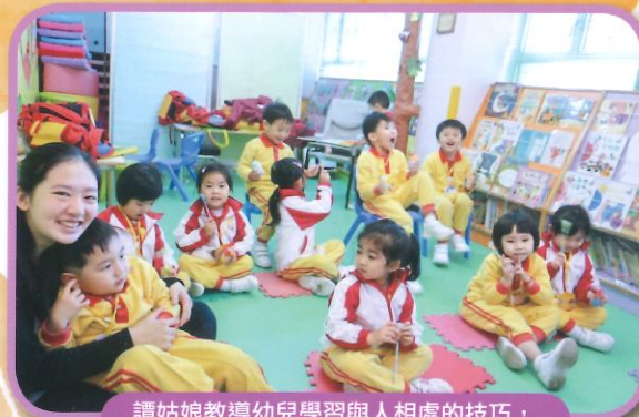
譚姑娘教導幼兒學習與人相處的技巧，樂也融融。