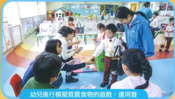
幼兒進行模擬買賣食物的遊戲，運用普通話向店主(家長扮演)溝通。