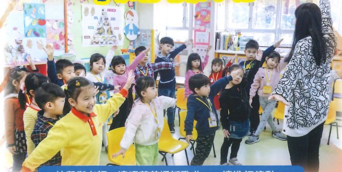
幼兒與老師一邊唱著普通話歌曲，一邊進行律動。