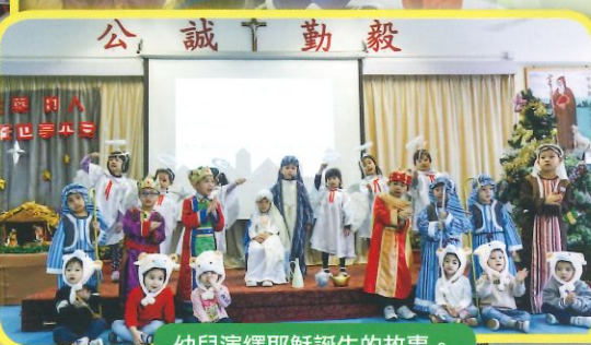
幼兒演繹耶穌誕生的故事。