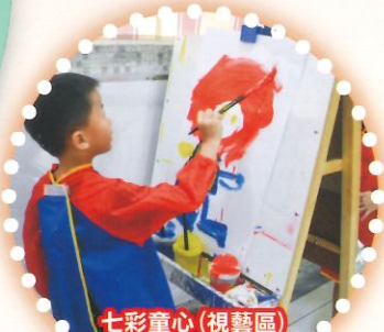
七彩童心(視藝區) 幼兒穿上圍裙在大畫板上自由創作。

每天能夠迎接小朋友喜樂地上學是我最感恩的事情，在幼稚園內聽到小朋友喜樂的笑聲，看到小朋友專注學習的神情、與我分享他/她的大事小事，以及陪伴他們閱讀、講故事、祈禱等，都能讓我更了解小朋友的內心世界。還記得在聖誕節快將來臨時，高班的小朋友會把自己定下的良好行為或者是需要改善之處寫在聖誕花環上，在《預祝聖誕祈禱會》時獻給主耶穌。祈禱能幫助小朋友培養正向的價值觀及良好品德，以下是一些例子：有小朋友在自己的聖誕花環上寫著：「我不玩手機了」來提醒自己要改掉玩手機的壞習慣；也有小朋友寫上：「我要安靜地吃飯，減少看電視，不要亂跑」、「我想改善自己，做個好孩子，要幫助媽媽做家務，因為我媽媽天天很忙」、「不害怕剪頭髮、不害羞、可主動一些」、「我以後要多聆聽媽媽的話」等等。從小朋友的祈禱意向中我們看到小朋友雖小，但他們同樣能夠自我反省、自我提升、關愛別人，特別是小朋友提到要幫助媽媽做家務，以減輕媽媽的負擔，因為她看到媽媽每天都很忙碌，而要關心媽媽的這份心，正正表達了天主教的五大核心價值中的「愛德」和「家庭」，我們需要互相關愛、互相包容、互相體諒、這些都是締造和平的基礎，在聖安當幼稚園這個大家庭，我們得到天主的保佑，在修女的帶領下，在大家的愛護中培育了一屆又一屆締造和平的種子。