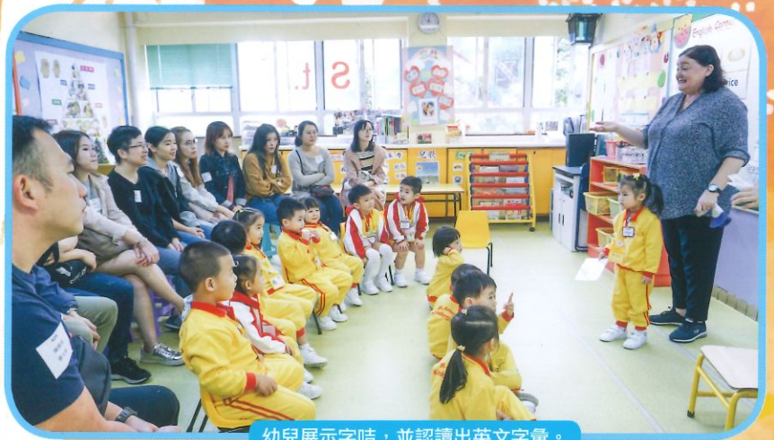
幼兒展示字咭，並認讀出英文字彙。