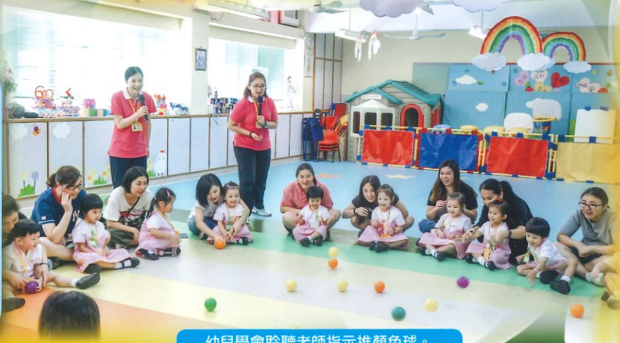
幼兒學會聆聽老師指示推顏色球。