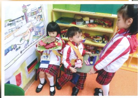
運用自行製作的食物模型作道具扮演食店的員工和客人。

學校提供了各種供幼兒自主探索和多元學習的機會，如與同儕進行扮演遊戲、科學探索實驗、參與機電工程講座、參觀聖安當小學天文室等，藉不同的學習體驗及活動讓幼兒在靈、德、智、體、群、美中均得以發展，並讓幼兒適應群體生活。