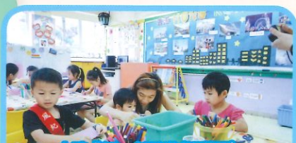
小孩「紙」創香港(視藝區) 幼兒與家長利用不同的圖工物料，合作拼砌出美麗的香港，表達愛香港情懷。