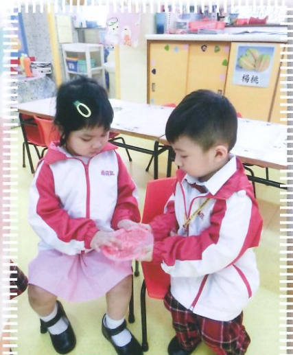
幼兒運用五官學習探索肉類的生和熟分別。