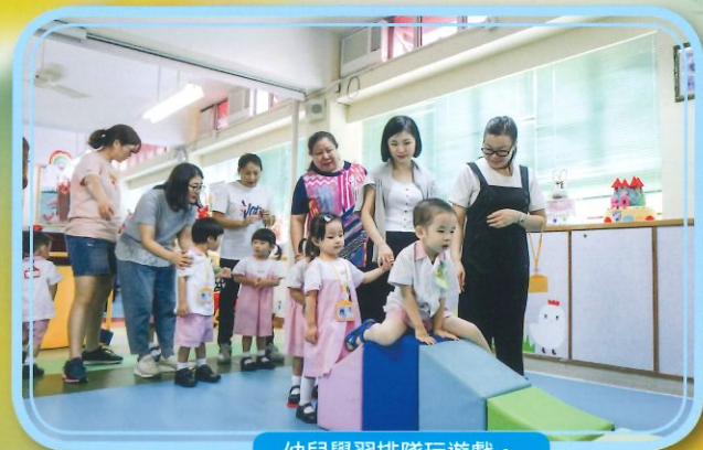
幼兒學習排隊玩遊戲。

在開學前，有幼兒適應日，家長與幼兒一同回校進行動，幫助幼兒更容易適應校園生活，大家都樂在其中。