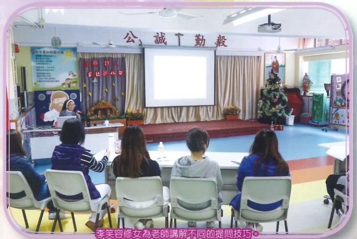
李笑容修女為老師講解不同的提問技巧。