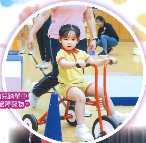
幼兒踏單車繞過障礙物。

為提升幼兒對運動的興趣，學校舉辦運動會及啦啦隊表演，以趣味性及團體合作的競技遊戲來讓幼兒關注運動對身體健康的重要，也培養幼兒互相合作，發揮團隊精神。