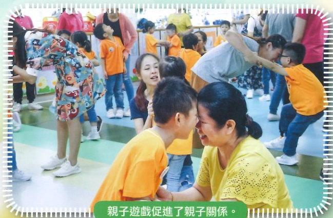
親子遊戲促進了親子關係。