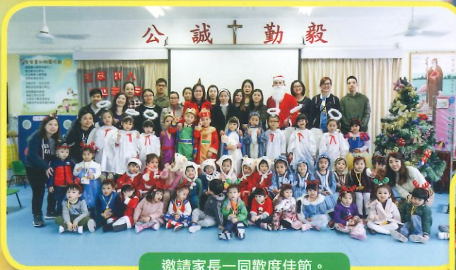
邀請家長一同歡度佳節。