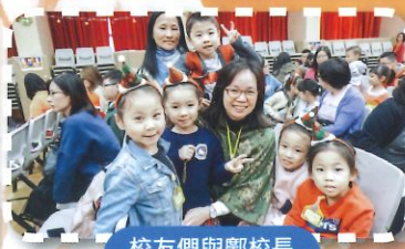
校友們與鄭校長開心歡聚。