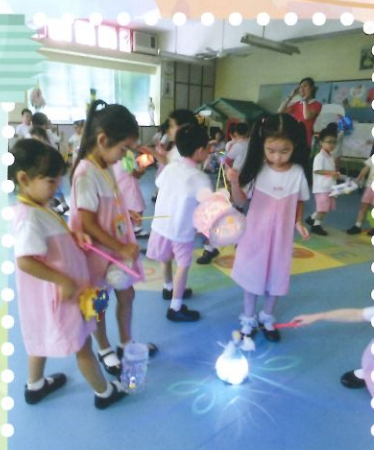
中秋佳節幼兒把自己喜愛或自製的燈籠帶回家與同儕提燈散步。

為讓學生能認識中國傳統文化，學校在中秋節前舉辦慶祝中秋之活動，如品嚐月餅、玩花燈，藉此認識中秋的習俗和傳統食物。