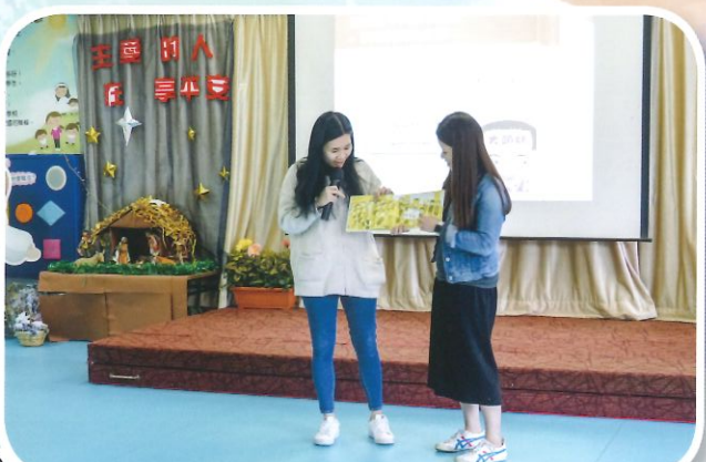
老師經過討論運用繪本故事設計後，和同事間分享。