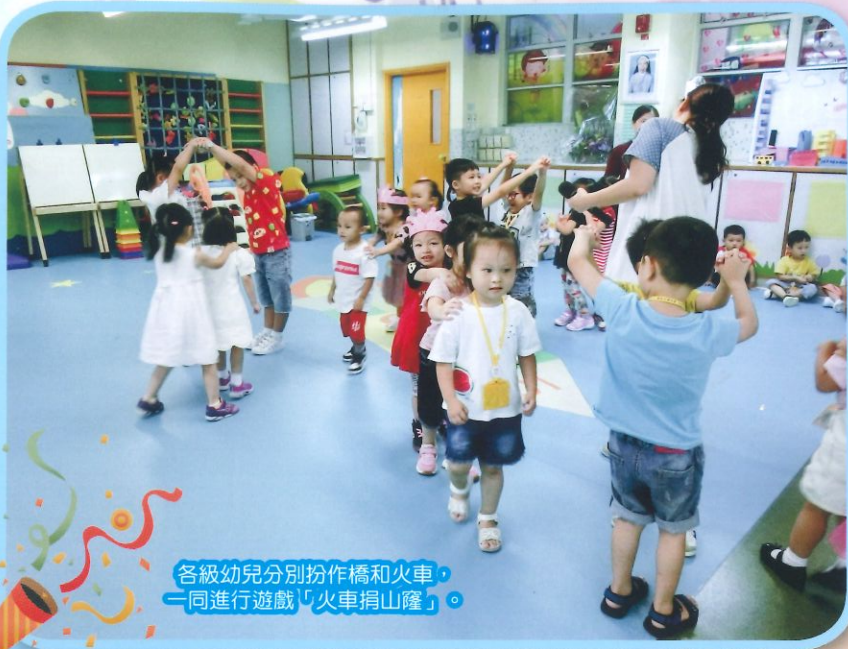
各級幼兒分別扮作橋和火車，一同進行遊戲「火車捐山窿」。

學校定期舉行生日會，讓幼兒一同慶祝生日，感謝天主賜予生命和父母生養之恩。生日會中讓幼兒混齡進行遊戲，使幼兒能互相學習和照顧。