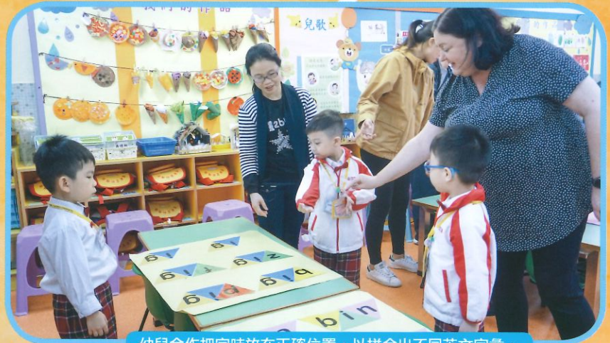
幼兒合作把字咭放在正確位置，以拼合出不同英文字彙。