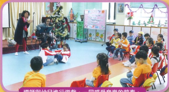
導師與幼兒進行遊戲，一同感受音樂的節奏。

讓幼兒透過音樂律動，以英語唱出不同的民歌。過程中，幼兒能以輕鬆的心情學習英文，提升英語的表達能力及增加學習英語的興趣。