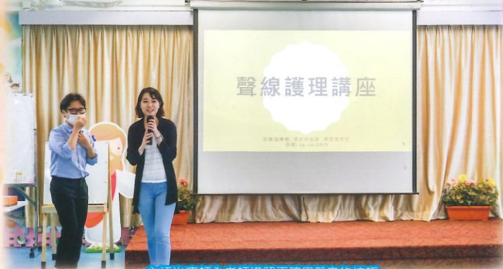
言語治療師為老師講解正確用聲音的技巧。