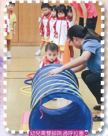
幼兒需雙腳跳過呼拉圈，然後爬過小隧道。