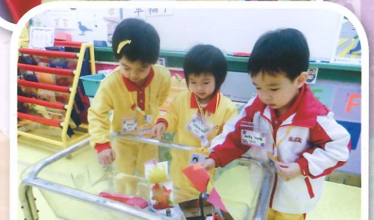
主題<<交通>>幼兒以不同物料製作船，並探索船在水上的浮沉狀況。