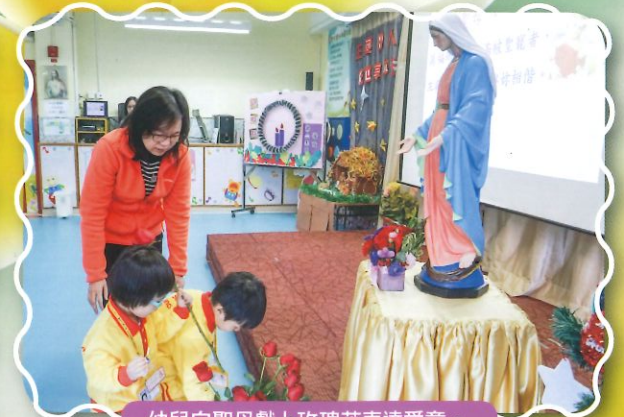
幼兒向聖母獻上玫瑰花表達愛意。