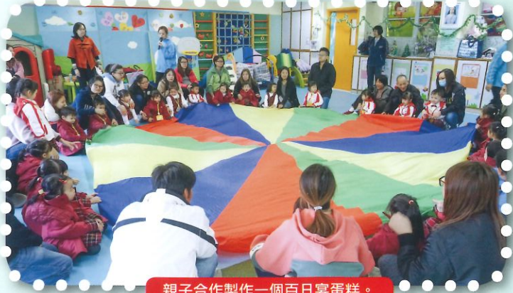
親子合作製作一個百日宴蛋糕。