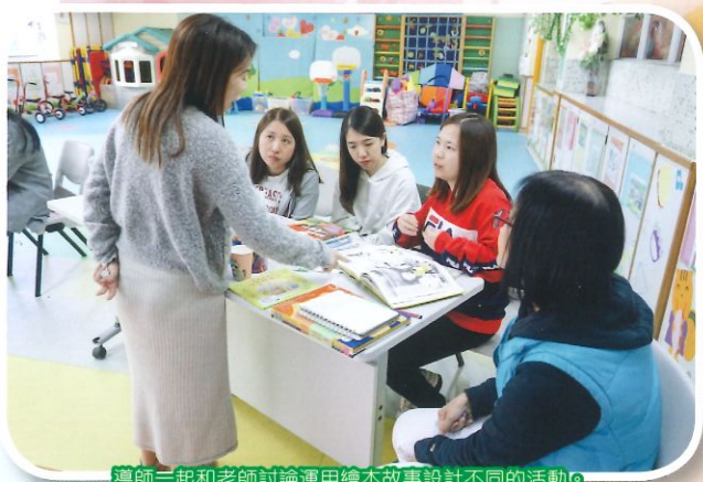
導師一起和老師討論運用繪本故事設計不同的活動。

繪本是幼稚園教師的最佳教材。小孩子愛聽故事，透過繪本教學，能有效帶領孩子了解故事中的人物，經歷其故事，從而產生同理心，發展情感教育及促進孩子的語文能力，啟發思維，發展不同的多方面的能力。