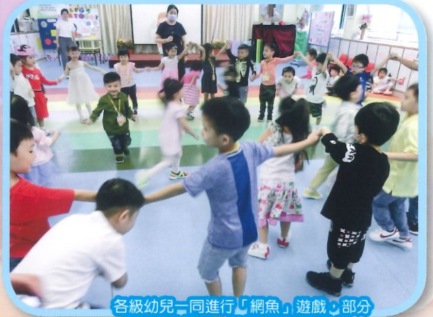
各級幼兒一同進行「網魚」遊戲，部分幼兒結成網手，捉住在網內的幼兒。