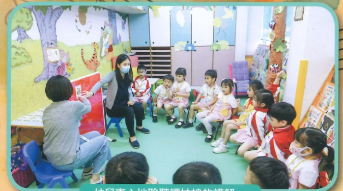
幼兒專心地聆聽譚姑娘的講解。