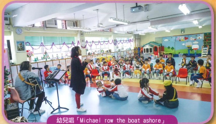
幼兒唱「Michael row the boat ashore」英文民歌一邊唱，一邊搖小船。