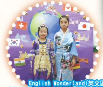
English Wonderland(英文區) 老師在課室內展示不同國家的衣服，讓我們穿著，感受不同國家的特色以及運用英文溝通。

本校於2019年8月31日舉行開放日，當日有多個不同的活動主題，有大自然與生活區、音樂區、美藝區、英文及普通話活動等等，讓外界更能了解聖安當幼稚園的特色。