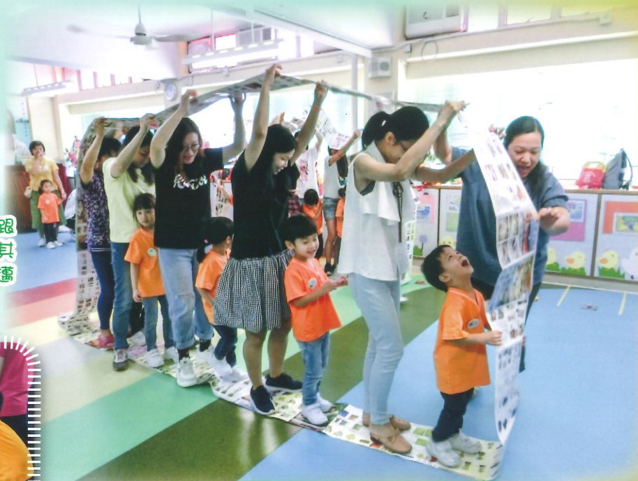
團員與家長一起製作紙捲向前邁進。

本年度基督小幼苗承諾禮的主題為「讓小孩到我跟前來」，神父為團員祝福，並見證他們的承諾。其後，透過親子遊戲讓家長及團員齊心合力地向前邁進，寓意能一起跟隨主耶穌，同證主愛。