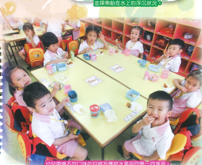
幼兒帶備不同口味的月餅及應節水果與同學一同享用。