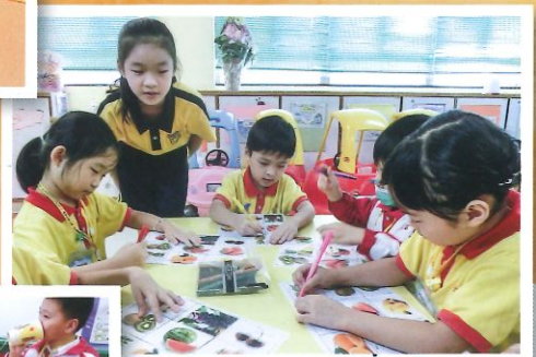
明愛成長的天空計劃：小學的哥哥姐姐到校與幼兒一同創作視藝作品、閱讀及進行bingo遊戲。